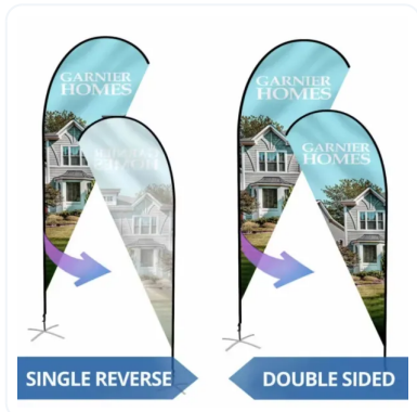
IMPRESIÓN 1 O 2 CARAS