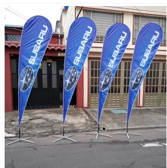
BANDERA PUBLICITARIA GOTA