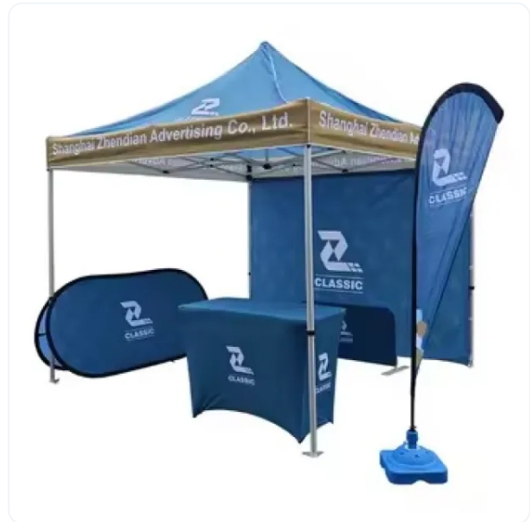
BANDERA PUBLICITARIA GOTA