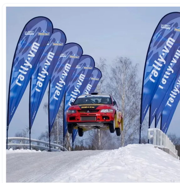
BANDERA PUBLICITARIA GOTA