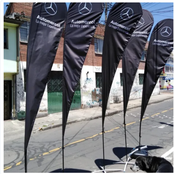
BANDERA PUBLICITARIA GOTA