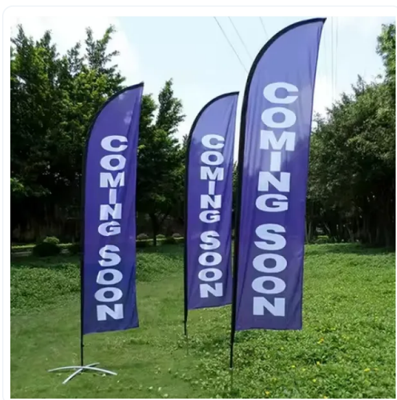
BANDERA PUBLICITARIA VELA