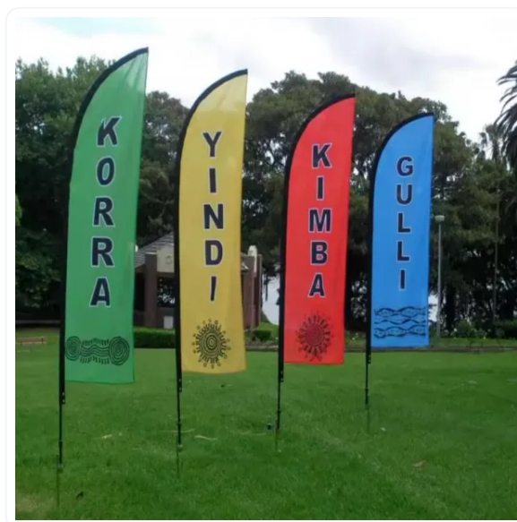
BANDERA PUBLICITARIA VELA