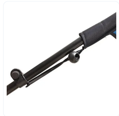
ANCLAJE A MÁSTIL