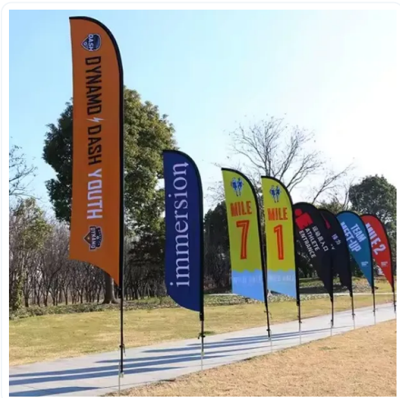
BANDERA PUBLICITARIA VELA