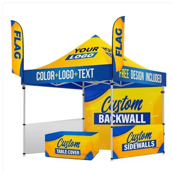
BANDERA PUBLICITARIA VELA