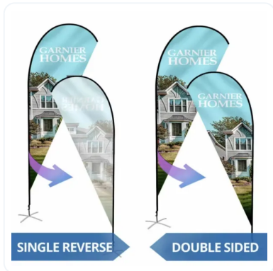
IMPRESIÓN 1 O 2 CARAS