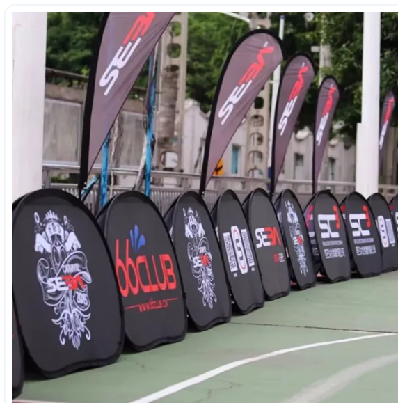
GOLF BANNER PUBLICITARIOS