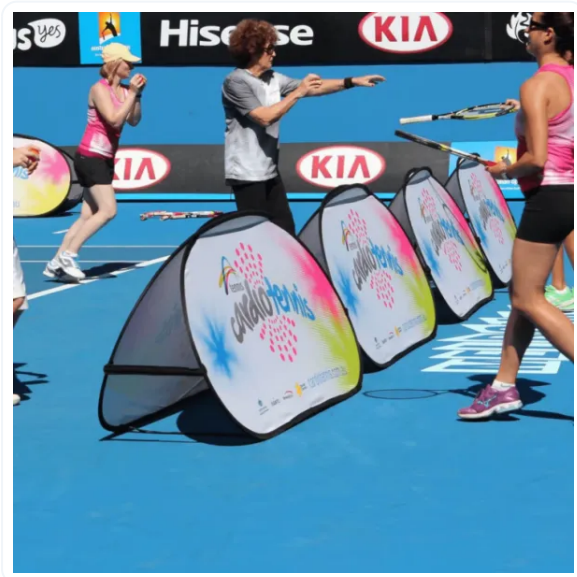
GOLF BANNER PUBLICITARIOS