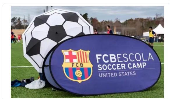
GOLF BANNER PUBLICITARIOS