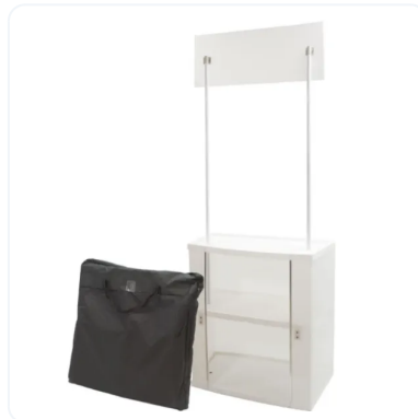
PARTES DE MOSTRADOR PLÁSTICO