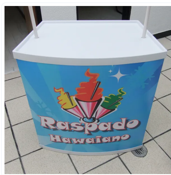
BASE SIN CENEFA