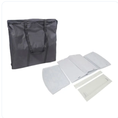
PARTES DE MOSTRADOR PLÁSTICO