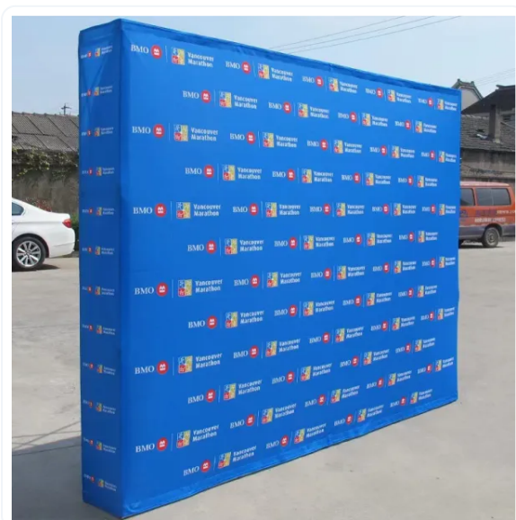
POP UP TEXTIL CON VELCRO