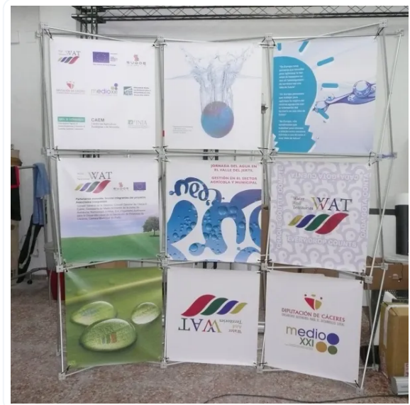
POP UP TEXTIL CON VELCRO