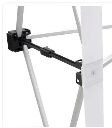
ENGANCHE DE CERRADO