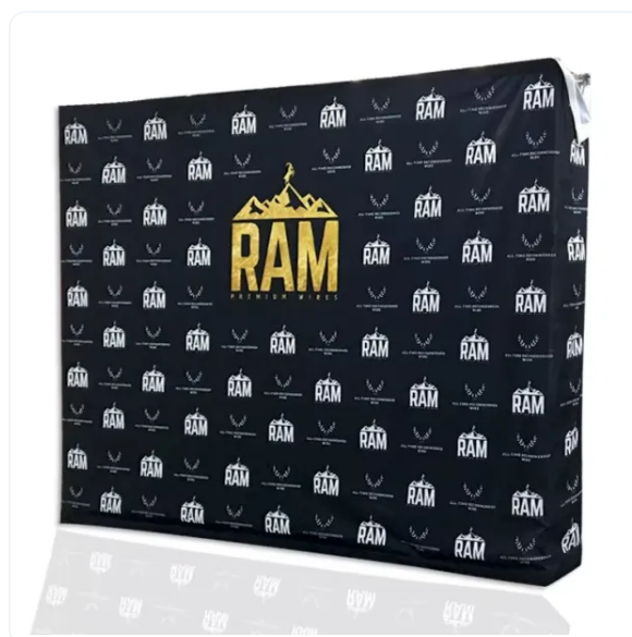
POP UP TEXTIL CON VELCRO