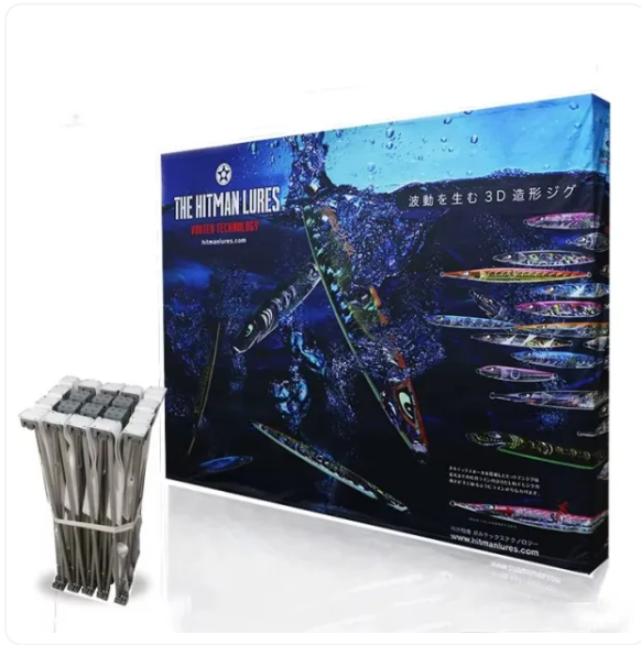
POP UP TEXTIL CON VELCRO