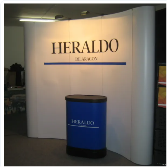
POP-UP 3 CUERPOS