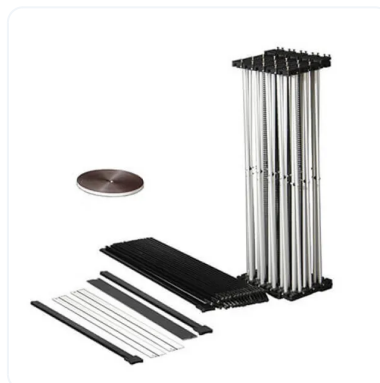
POPOP CURVO MAGNÉTICO