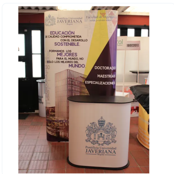
POP-UP 1 CUERPO