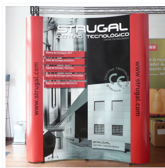
POP-UP 2 CUERPOS