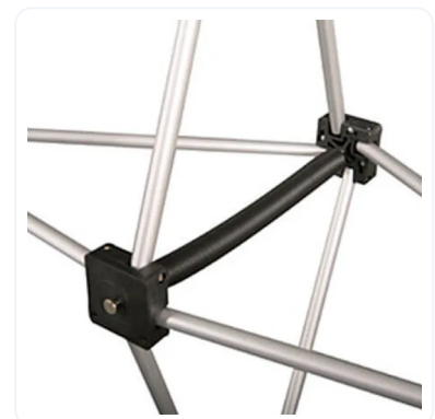
POPOP CURVO MAGNÉTICO