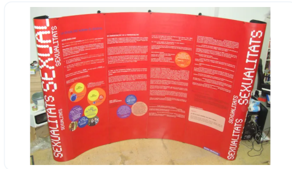
POP-UP 4 CUERPOS