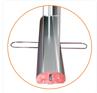
PATA O PIE PARA ESTABILIDAD.