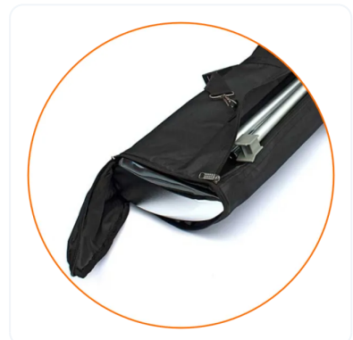
BOLSA DE NYLON NEGRA.