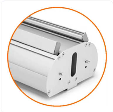
ROLLUP DE LUJO ESTRUCTURA