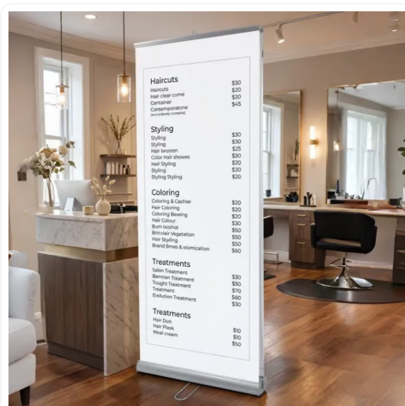
ROLLUPS QUE IMPACTAN Y TRANSMITEN CALIDAD