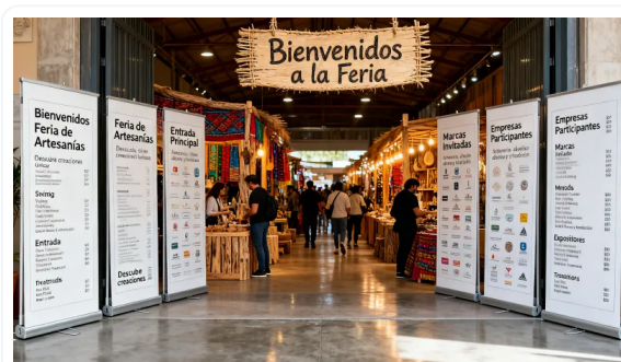
VERSATILIDAD DE USOS