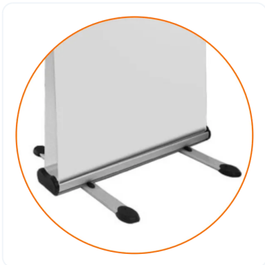
ROLLUP PARA EXTERIORES