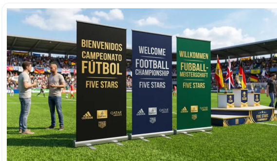
COMUNICAR ES VENDER