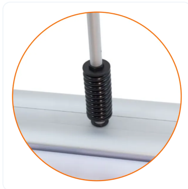
MUELLE O RESORTE DE SEGURIDAD.