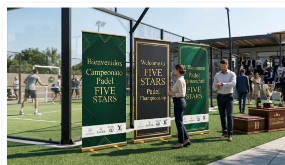
AUMENTE LA RETENCIÓN DE ATENCIÓN DE LOS CLIENTES