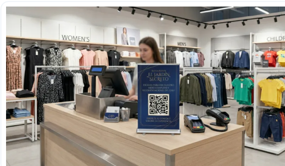
VERSATILIDAD DE USOS