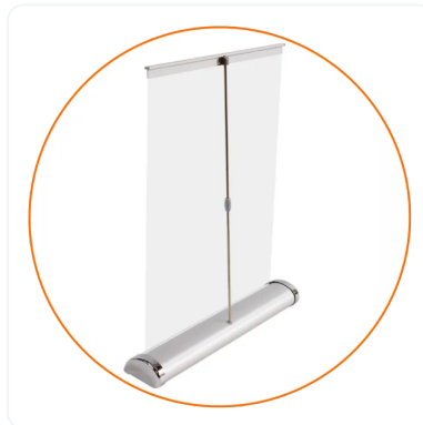
ANCLAJE DE MÁSTIL A BASE