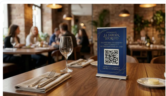
COMUNICAR ES VENDER