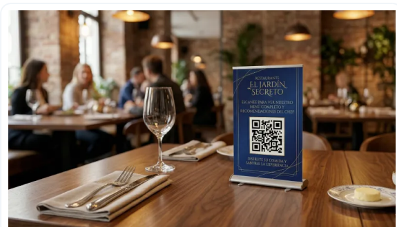
COMUNICAR ES VENDER