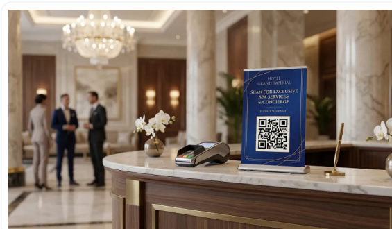
ROLLUPS QUE IMPACTAN Y TRANSMITEN CALIDAD