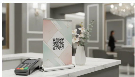
AUMENTE LA RETENCIÓN DE ATENCIÓN DE LOS CLIENTES