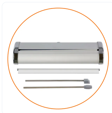
PARTES DE LA ESTRUCTURA.