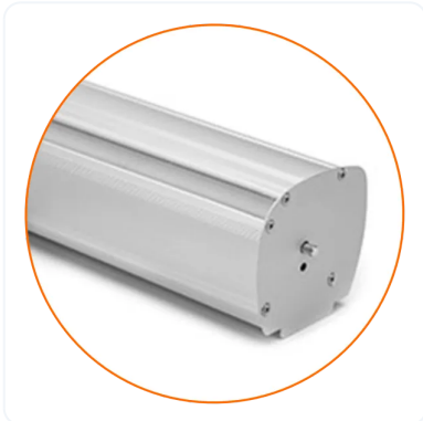
ROLL-UPS ESENCIALES ECONÓMICOS