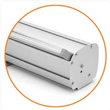
ROLLUP DE MÁS VENDIDO