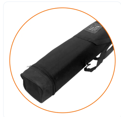
BOLSA DE NYLON NEGRA.