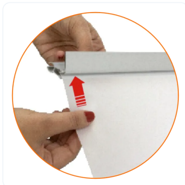
AGARRE A PRESIÓN DE LA GRÁFICA