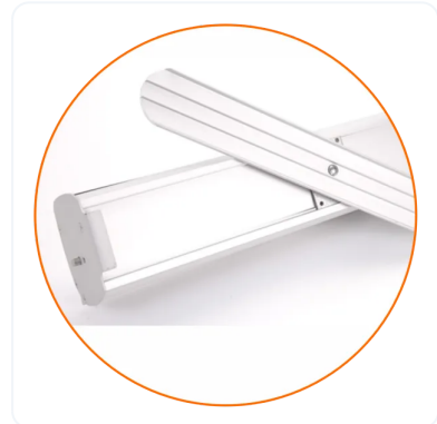
NIVELADORES PARA ESTABILIDAD.