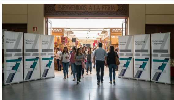
AUMENTE LA RETENCIÓN DE ATENCIÓN DE LOS CLIENTES