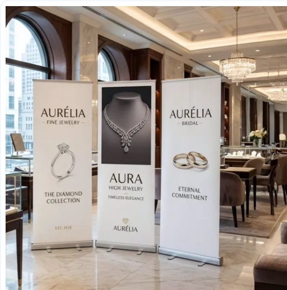
ROLLUPS QUE IMPACTAN Y TRANSMITEN CALIDAD