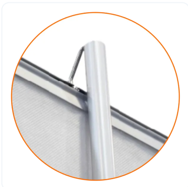
ENGANCHE SUPERIOR DEL ROLLUP