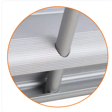
ANCLAJE DE MÁSTIL A BASE