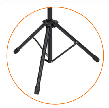
ROLL-UPS ESENCIALES ECONÓMICOS