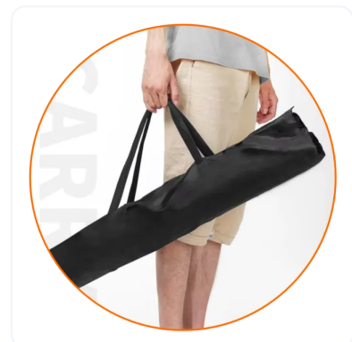
BOLSA DE NYLON NEGRA.