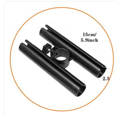
ANCLAJE DE IMAGENES