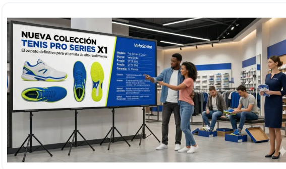
TRÍPODES QUE IMPACTAN Y TRANSMITEN CALIDAD