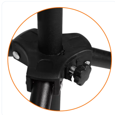
ANCLAJE DE MÁSTIL A BASE