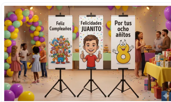
AUMENTE LA RETENCIÓN DE ATENCIÓN DE LOS CLIENTES