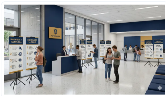
VERSATILIDAD DE USOS