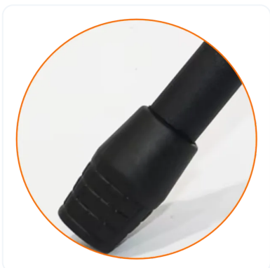
ANTI DESLIZANTE EN PATAS.