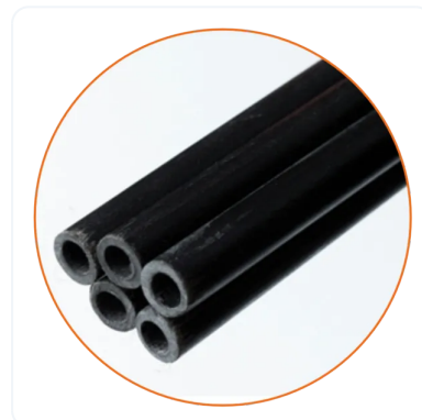
VARILLAS EN FIBRA