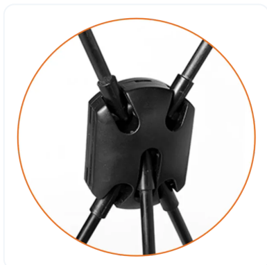
NUDO O UNIÓN PRINCIPAL